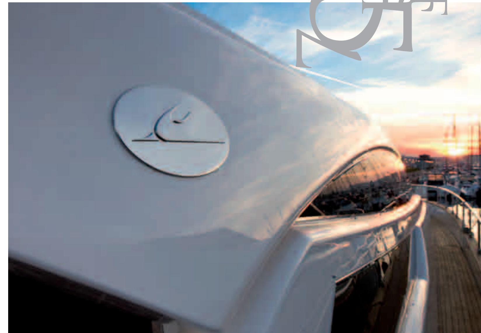
ORIGINALITY AND REDESIGN OF THE INTERIOR SPACES AND FINE ATTENTION TO DETAIL: THE CAYMAN 75 HT IS DESIGNED TO BE ENTIRELY UNIQUE.