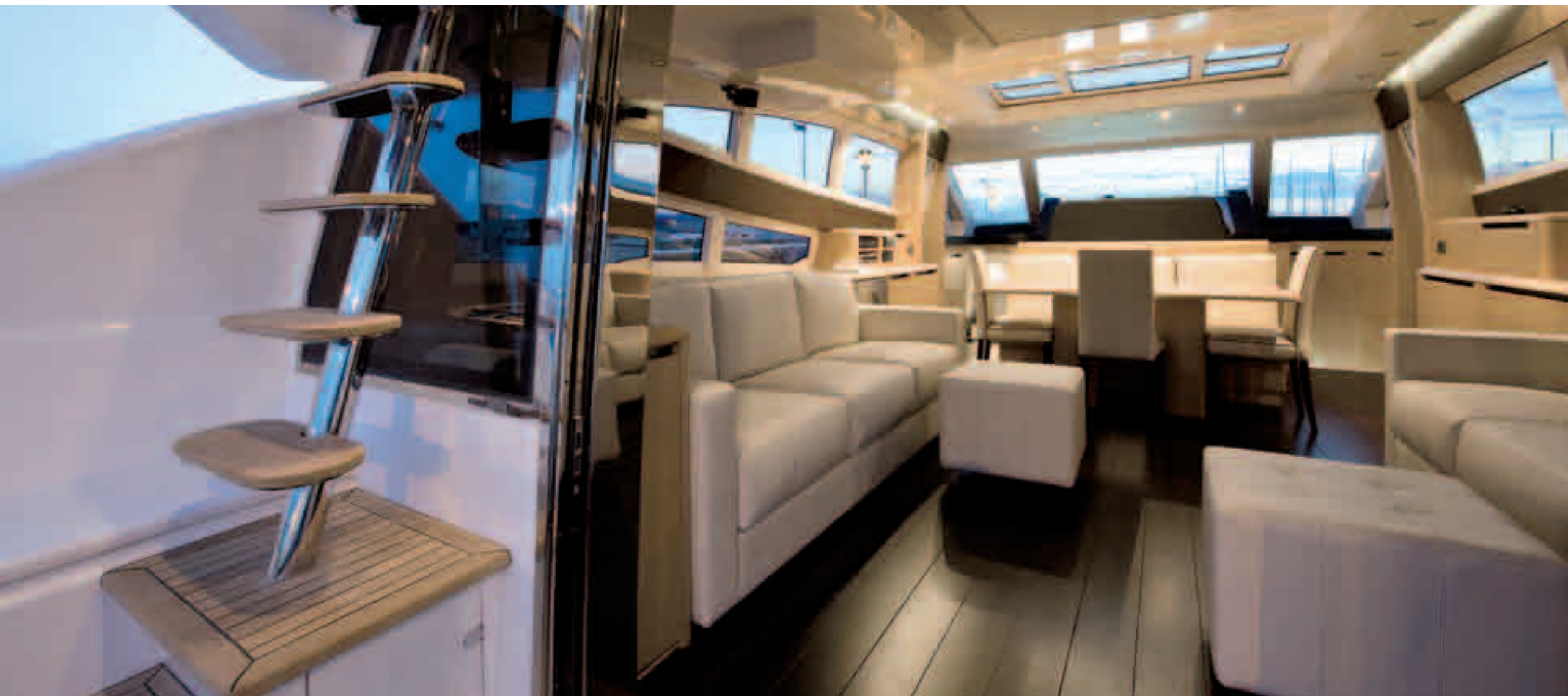
ORIGINALITÀ E RINNOVAMENTO NEGLI SPAZI, CURA DEI DETTAGLI: CAYMAN 75 HT È PROGETTATO PER ESSERE UNICO.